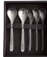
ティースプーン 5pcs 3,300円 (税込)