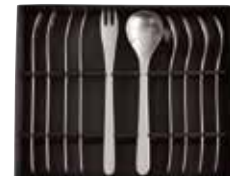
ティースプーン ヒメフォーク 10pcs 5,500円 (税込)