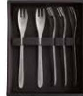
ケーキフォーク 5pcs 3,300円 (税込)