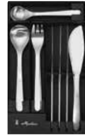
デザート 20pcs 16,500円 (税込)