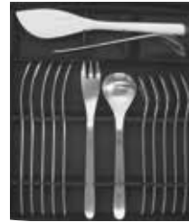
フルーツ 14pcs 7,700円 (税込)